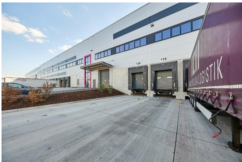
Bild 2: Die vier Gebäude verfügen über 173 Industrie-Sektionaltore von Hörmann, von denen 28 ebenerdig verbaut wurden und auch 40-Tonnern eine direkte Zufahrt in die Hallen ermöglichen.